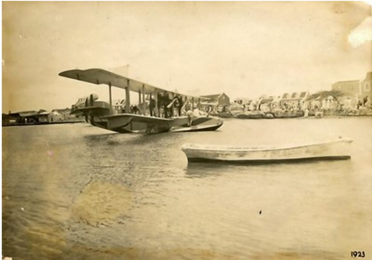
Otro potret dilanti di (Gezaghebbberskantoor) 1923 similar cu mi a post hunto cu esun di binnenwater na Corsou

Nassau. De landing vond plaats in Parera op het binnenwater van het Schottegat, ter hoogte waar later de Antilliaanse Brouwerij stond. Een Amerikaanse